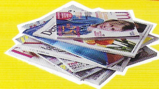
Tous les papiers