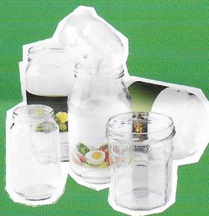
Pots et bocaux en verre (sans couvercle)