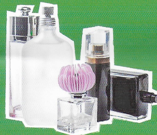
Flacons en verre