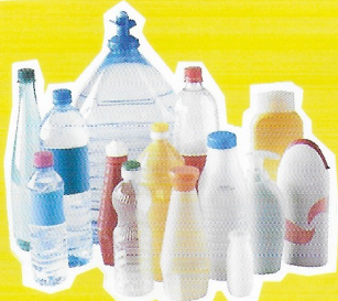
Bouteilles et flacons plastiques