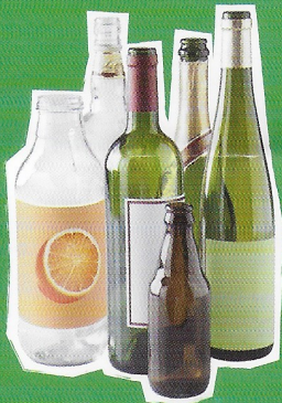
Bouteilles en verre