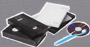
Petits objets en plastiques